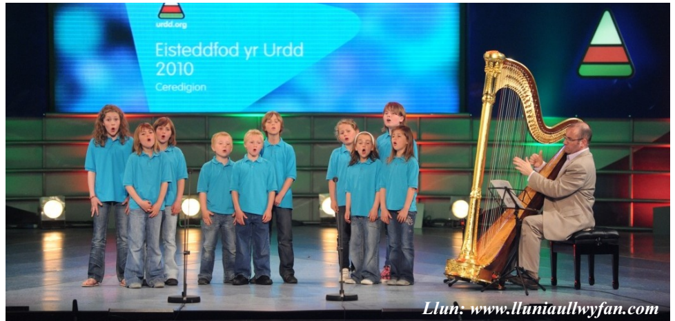
Buddugwyr: Parti Cerdd Dant Adran Bentref Ysbyty Ifan ar lwyfan Eisteddfod yr Urdd. Beth fydd dyfodol yr adrannau hyn wedi ad-drefnu ysgolion?

Holi (yn hynod bryderus hefyd) y mae pawb, tybed a fydd gweithgarwch fel hyn yn yr ardaloedd yma a'u tebyg pan fydd ysgolion bach yn cau, a hynny yn groes i ddymuniad llywodraethwyr a rhieni. Roedd pob un o ddisgyblion CA2 o ysgolion yr tair ardal a nodwyd ar lwyfan Prifwyl yr Urdd.