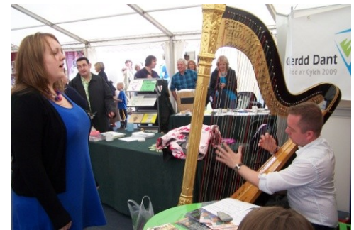
Tŷ Gwerin 2009

Dewch draw i ymweld â ni yn stondin 713 -716. ****GWEITHGAREDDAU****